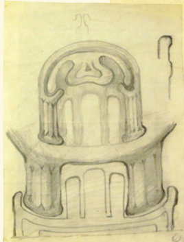
Skizzen zum Goetheanumbau, Manuskript «Geheimwissenschaft», Stenogrammblock

Zentrum für Dokumentation und Edition des wissenschaftlichen und künstlerischen Werkes von Rudolf Steiner.