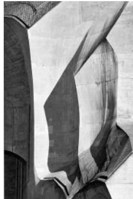
Plastische Architekturformen, organisch gestaltet

Dieser Gedanke der geistigen Entsprechung der umgebenden Landschaft im Goetheanum-Bau ließ Stuten nicht mehr los und wurde seine Leitidee für seine Forschungen. «Wie der Bau in der Landschaft